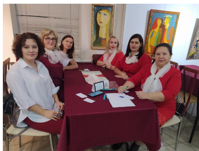
Активное участие в Профсоюзной деятельности. КВН.