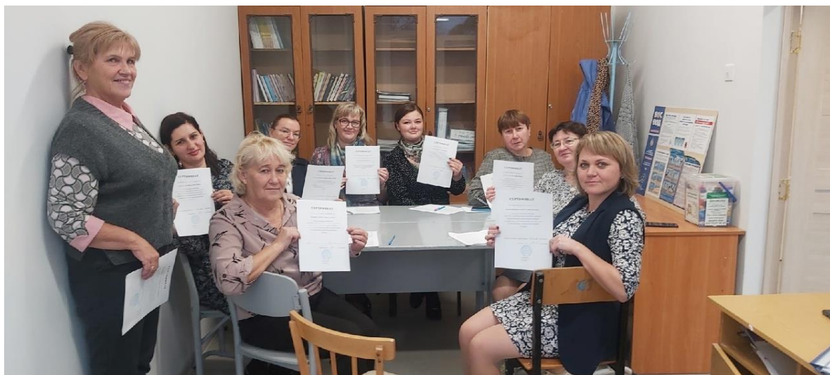
Психологический тренинг «Профилактика конфликтов. Грамотное реагирование» (16 ч)